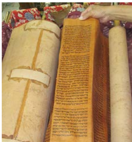
200-летний свиток Торы, выполненный на гевиле.

Библия — это основа христианства, и Бог доверил Свое Слово людям с техническими профессиями и человеческим технологиям, чтобы сохранить, защитить, воспроизвести и распространить его. Библейское повествование начиналось как устная традиция, пока технология не смогла представить подходящее основание для письма, подходящие чернила и методы сохранения. Слово Божье было настолько драгоценным для ранних христиан, что они хранили его, оберегая даже ценой жизни. И это побудило изобретателей того времени искать возможности сохранения Слова Божьего и его тиражирования и распространения.