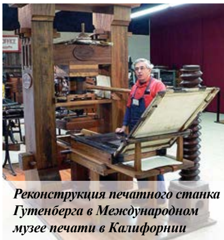
Реконструкция печатного станка Гутенберга в Международном музее печати в Калифорнии

В период с 1450 по 1455 год Гутенберг напечатал около двухсот экземпляров Библий. Одни были изготовлены на пергаменте, другие на бумаге — более дешевой и легкой изготавливаемой основе для письма. У Гутенберга закончились деньги, и его пресс был изъят одним