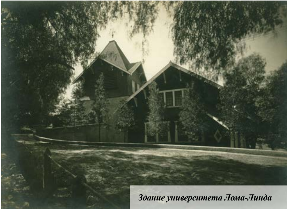
Здание университета Лома-Линда

Одной из серьезных проблем, с которой столкнулась церковь в сфере образования, была проблема аккредитации собственных образовательных учреждений. В конце XIX — начале XX века в США в целях контроля за сферой образования и повышения качества высшего профессионального образования стали создаваться региональные аккредитационные ассоциации 1 .