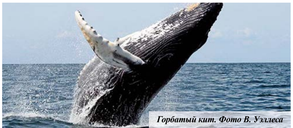
Горбатый кит. Фото В. Уэллеса

Это только начало долгого пути разработок, вдохновение которых черпается в сотворенной Богом природе.