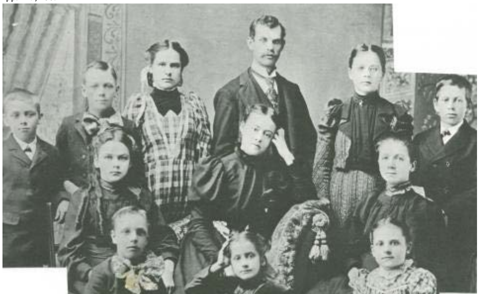
Учащиеся одной из первых адвентистских школ в Мичигане, 1898 г.

Начало XX века принесло с собой серьезные изменения в американской системе высшего образования. Поворотным моментом стал отчет Абрахама Флекснера, известного американского теоретика образования и врача-эпидемиолога, подготовленный им для Американской медицинской ассоциации. В 1910 году он проинспектировал 163 медицинские школы в сорока американских штатах, сравнил требования, предъявляемые ими при поступлении, количество студентов и факультетов, доступность обучения на клинических базах. В результате он рекомендовал закрыть 124 школы из-за низкого качества обучения в них, нерационального